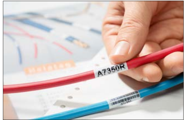
Selbstlaminiierende Helatag Etiketten bieten Schutz gegen Abrieb und Umwelteinflüsse.