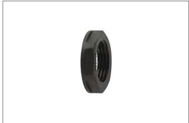
HelaGuard ALPA Gegenmutter, PA66.

Die sechskantige ALPA Gegenmutter dient als zusätzliche Sicherung der Verschraubung.