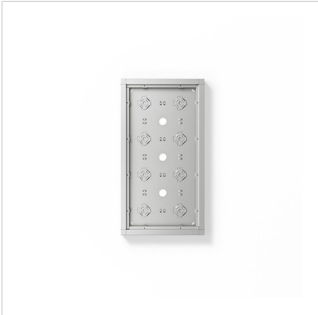
Gehäuse-Aufputz GA 612-4/2-01 SM