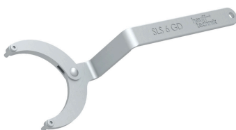
SLS 6G, Gelenkstirnlochschlüssel