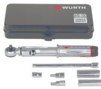
WKZ U, Universelles Werkzeugset