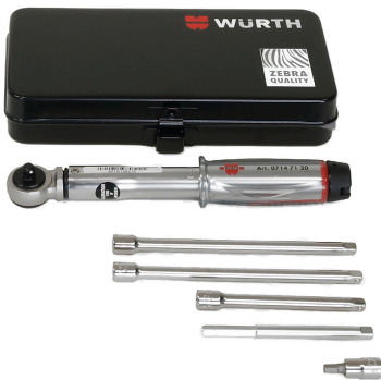
HSI150 DG/HRK SSG WKZ, Werkzeugset für HSI150 DG/HRK SSG