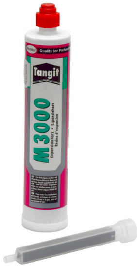
EH 300/1400, 2-Komponentenharz M3000