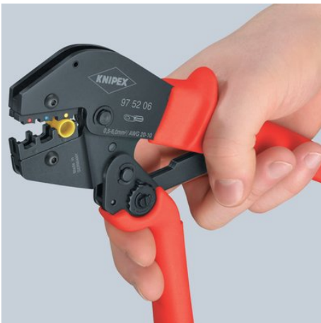
Erster Schritt: Heranholen des Schenkels mit zwei Fingern, bis beide Backen auf dem zu vercrimpenden Verbinder aufliegen