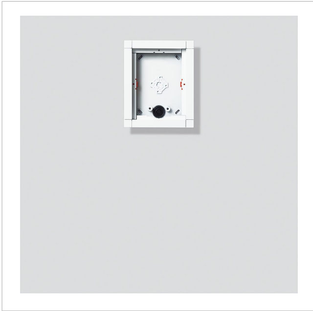
Gehäuse-Aufputz GA 612-1/1-0 AG 210004918-00