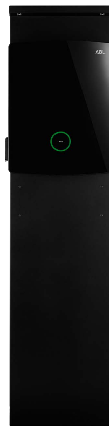
Levering zonder apart verkrijgbare Wallbox eM4 Twin

De zuil POLEM4 Twin wordt gebruikt voor de montage van een Wallbox eMH3 of eM4 Twin van ABL. De POLEM4 Twin overtuigt door zijn aantrekkelijke en compacte metalen behuizing met deur aan de achterkant ter bescherming van de inbouwcomponenten. De zuil is volledig vooraf geïnstalleerd dankzij de geïntegreerde aansluitklemmen. Een additionele vrije DIN-rail is voormonteerd voor extra inbouwcomponenten en een C-rail is voorzien voor de trekcontlasting van de toevoerleiding. Het weerbestendig dak WPR36 en de CABHOLD laadkabelhouder zijn qua kleur afgestemd op de zuil (RAL 9011) zodat zij harmoniëren met het geheel van het oplaadpunt. Dankzij de in het bovendeel geïntegreerde Leds met schemerschakelaar wordt de Wallbox voldoende verlicht, ook bij slechte lichtomstandigheden. De schroefdraadbouten zijn af fabriek aangebracht en afgedekt met blindstoppen, daardoor hoeft er niet meer geboord te worden. Voor een stabiele plaatsing adviseert ABL om de zuil te monteren op het optioneel verkrijgbare betonfundament EMH9999.