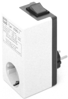
Abb. 1 / Fig. 1