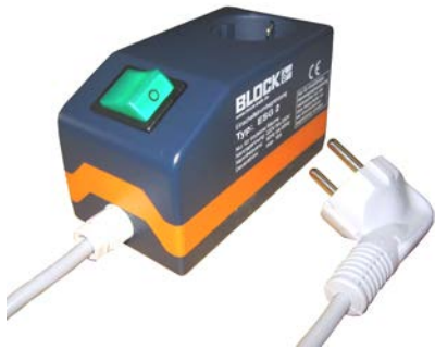
Abb. 2 / Fig. 2