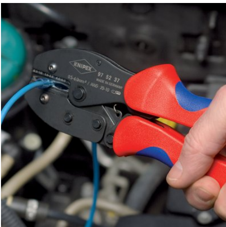
97 52 37

Technische Änderungen und Irrtümer vorbehalten