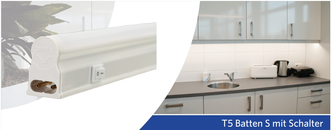
T5 Batten S mit Schalter