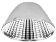
550098001000 LEDSpot3C-C-P R65-Reflector-24D