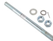
545098003200 LEDHighbay-Pole and Adapter

Highbay Pole and Adapter (545098003200) sind nur mit 80W- und 110W-Versionen kompatibel. Highbay Pole (545098003900) ist nur mit 150W-, 200W- und 220W-Versionen kompatibel.