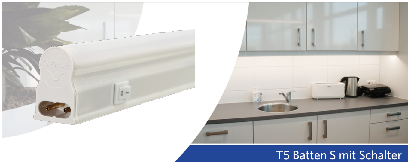
T5 Batten S mit Schalter