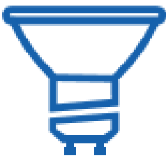
Abmessungsskizze LED LM85488

Die Lichtfarbe warmweiß oder neutralweiß sind mit jedem Lichtschalter durch Ein/Aus-schalten einstellbar.