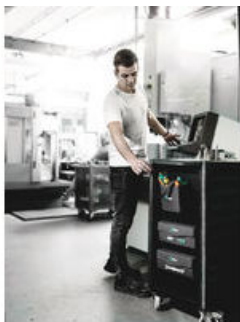
Wera 2go 4 Köcher