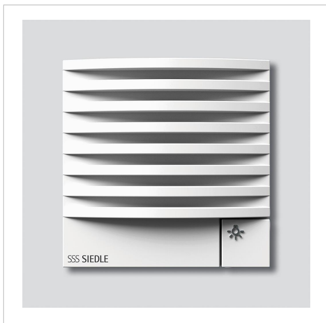
Türlautsprecher-Modul Line-Level TLM/LL 611-02 W 200087580-00