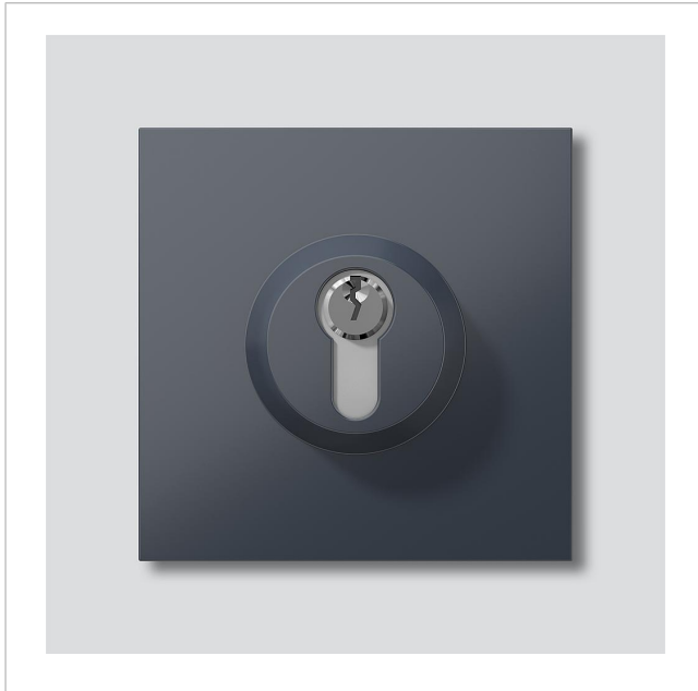
Schloss-Modul SM 611-01 AG 210004992-00