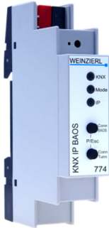
Foto des Geräts

Kompakte busversorgte Schnittstelle und ObjectServer zwischen LAN und KNX-Bus