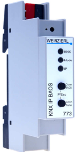
Foto des Geräts

Kompakte busversorgte Schnittstelle und ObjectServer zwischen LAN und KNX-Bus