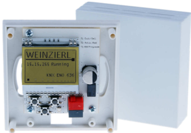
Foto des Geräts

Bidirektionales Gateway zwischen KNX Bus und EnOcean Funk mit Security-Funktionen