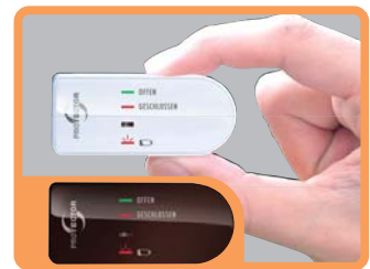
FENSTER SENDEGERÄHE ZUSÄTZLICH IN BRAUN BEIGEFÜGT