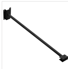
3107121 Ausleger von 1000 mm Schwarz