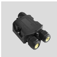
14174220 Anschlussbox IP 66