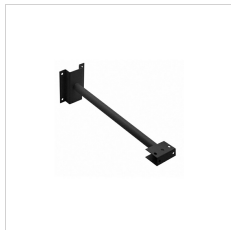
3107120 Ausleger von 500 mm Schwarz