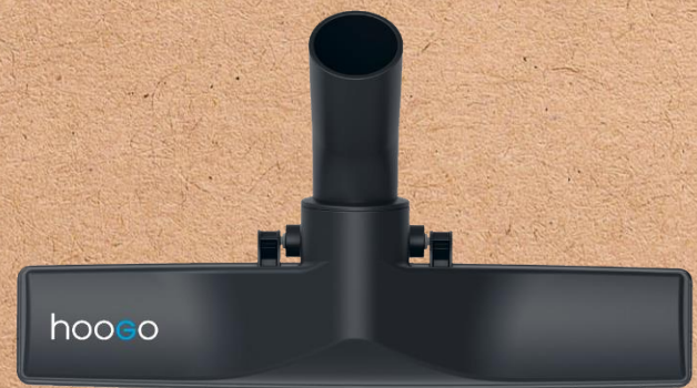
Parkettdüse für alle Arten von Hartböden - Besonders gründliche Fugenreinigung, schmal & wendig