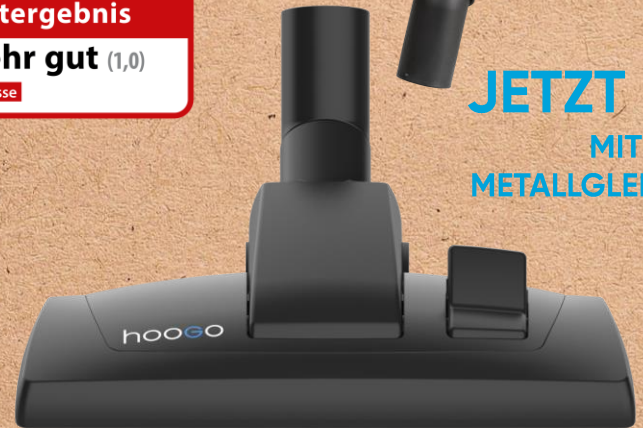
High-End Leichtlauf Bodendüse „Wessel-Werk RD295“ Metallgleitsohle, umlaufender Bürstenkranz, Komfort-Laufwalze