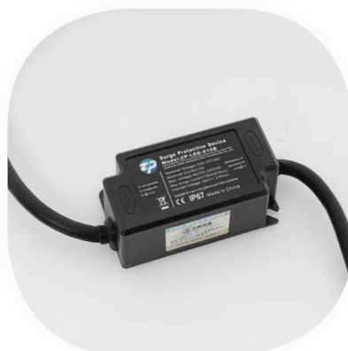
Überspannungsschutz für eine Leuchte bis 600W Schutzart IP67

*Nach DIN VDE 0100-443 und -534 ist ein Überspannungsschutz seit Dezember 2018 Pflicht.