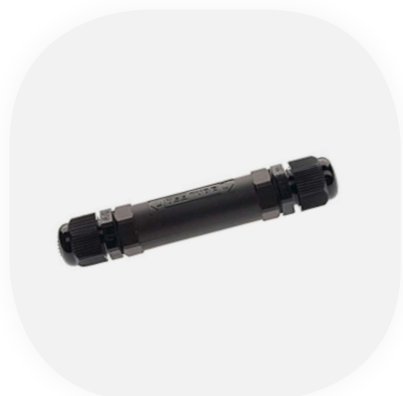
3-pol. Verteiler Schutzart IP68 Inklusive Klemmenstein für Leistungsdurchmesser 6-12mm