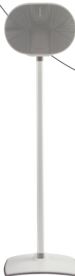
STANDFÜSSE FÜR SONOS ERA 100™