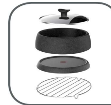
Glasdeckel, Grillplatte, Fonduetopf