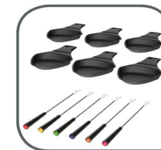
6 Pfännchen & 6 Fonduegabeln