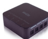
1x Optical Digital Audio Switcher