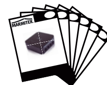
1x User manual