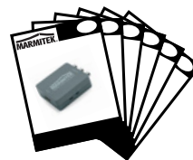
1x User manual