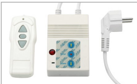
MEDIUM Design-Rollo Electric IR, Infrarotsteuerung mit Handsender und Netzstecker oder Wandbedienteil