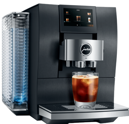
Aluminium Dark Inox (EA)